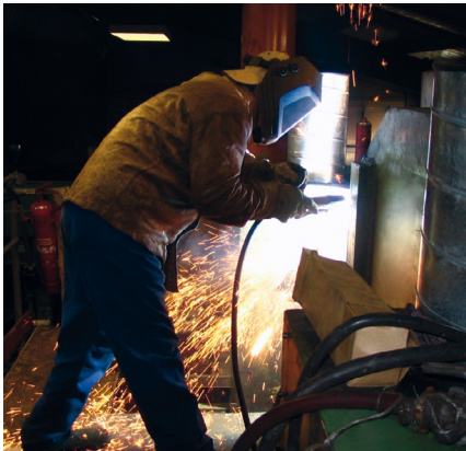
Schweißer beim Lichtbogenfugen zur Entfernung eines Risses im Maschinenkörper.