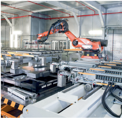
Entstapelroboter mit Scherenhubtisch und automatisch anstellbaren Spreizmagneten.