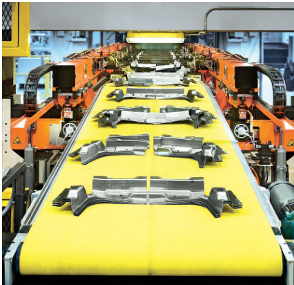
Schuler Transfer Pro Trans.