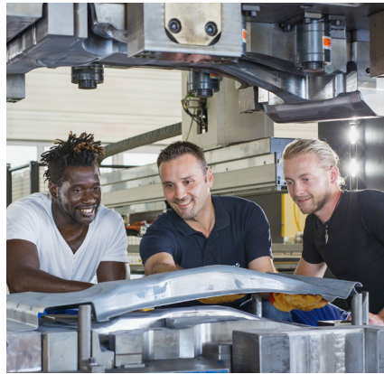
Formhärte Werkzeuge live erleben.