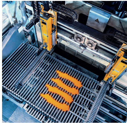
Formhärtebauteile vor der Umformung.