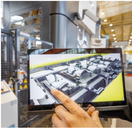
Schuler „Smart Assist“ Bediener-Software.