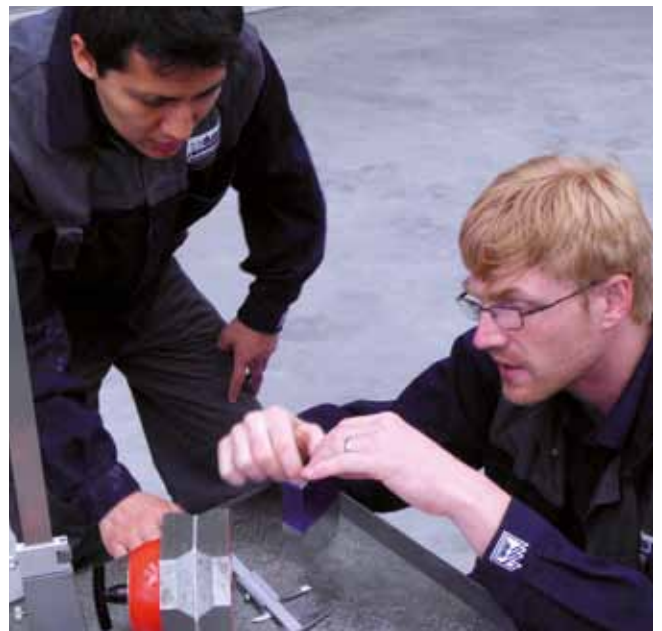
Curso de especialización con instructores alemanes cualificados.