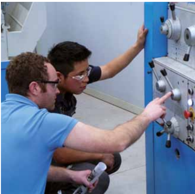
Aplicación práctica de lo aprendido.

Además de los estudios de especialización, ofrecemos posibilidades especiales de ampliación de estudios.