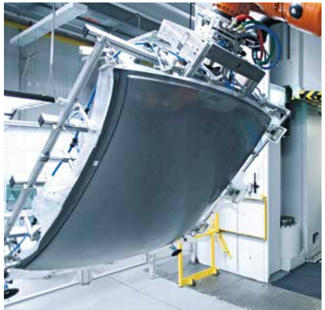
Serienfertigung von Carbondächern.

Innovative Systemlösungen von Schuler kombinieren modernste Komponenten und praxiserprobte Bausteine zu hochautomatisierten Fertigungslinien. Wir beraten Sie entlang der ganzen Wertschöpfungskette. Möglich wird das dank unseres Fachwissens über Materialien für den Leichtbau bis hin zum Multi-Materialmix, das Ihnen beispielsweise die Produktion von stabileren und leichteren Hybridteilen aus Stahl mit faserverstärktem Kunststoff gestattet. Darüber hinaus sorgen unsere Spezialisten für eine ständige Verbesserung des Prozesses und eine Flexibilisierung der Anlagen, mit denen Sie Innovationen wie die B-Säule als Faserverbund produzieren können.