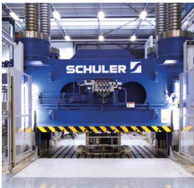
Schuler 36.000 kN Kurzhubpresse bei unserem Kunden NCC.