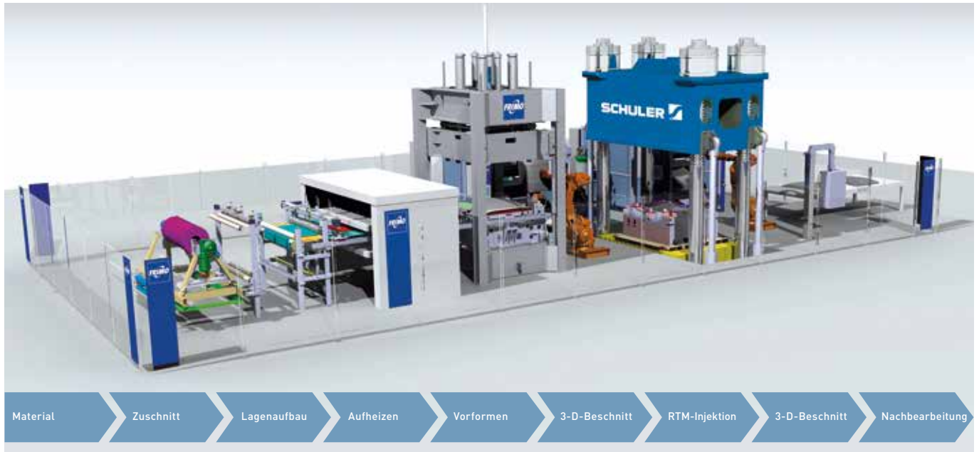
Modulares Baukastensystem: Fertigungslinie für RTM-Bauteile.

Wir unterstützen Sie in partnerschaftlicher Zusammenarbeit und ermöglichen Ihnen so eine einfache und unkomplizierte Planung und Umstellung auf die neue Anlage.