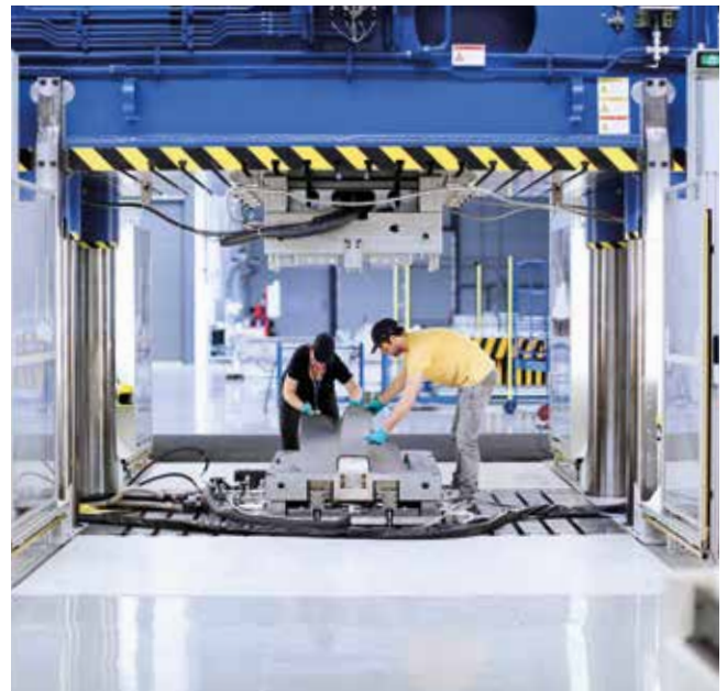
Kontinuierliche Forschung und Entwicklung ermöglichen neue Spitzenleistungen.

Die Veränderung geht weiter. Mit iComposite 4.0 beginnt unter der Federführung von Schuler ein neuer Weg: Mit dem Forschungsprojekt soll der wirtschaftlichen Serienfertigung von Teilen aus faserverstärktem Kunststoff der Weg geebnet werden – durch gesteigerte Ressourceneffizienz. Den Ausgangspunkt bildet das additive Faserspritzen, mit dem hochproduktiv die Grundstruktur des