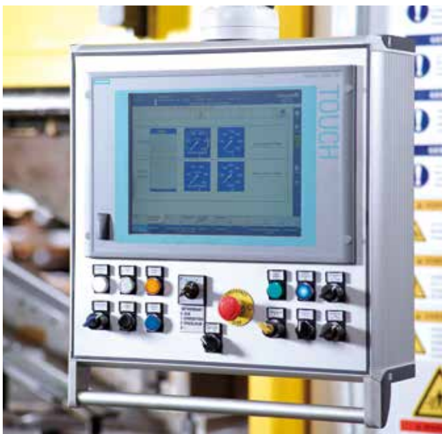
Schüler-Bedienführung: übersichtlich und selbsterklärend.