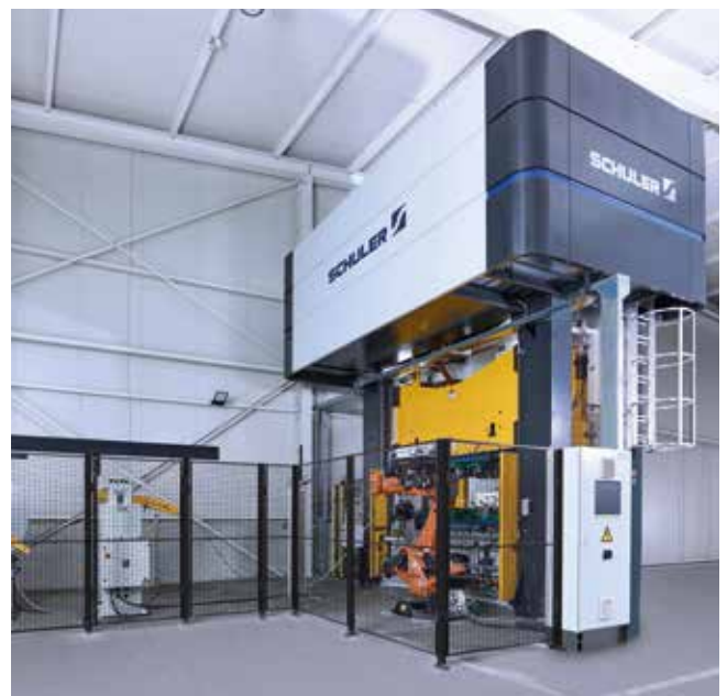
Automatisierte Fertigungszelle zur Herstellung von Automotive-Teilen.

Die Pressen der HPX-Baureihe sind für ein günstiges Preis-Leistungs-Verhältnis konzipiert. Sie decken ein universelles Einsatzspektrum ab und sind erweiterbar für automatisierte Fertigungssysteme. Hohe Qualitätsstandards sorgen für Investitionssicherheit und Wartungsfreundlichkeit. Pressen der Baureihe HPX verbinden maximale Fertigungsflexibilität mit Komfort im Alltagsbetrieb. Und nicht zuletzt steht Schuler für zuverlässige, bewährte Pressen mit hoher Verfügbarkeit, für kurze Lieferzeiten und jederzeit verlässliche Service-Qualität.