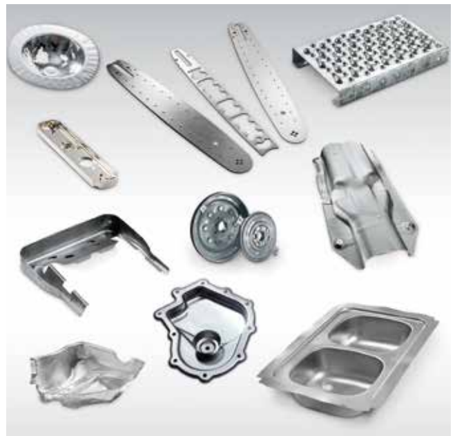
HPX-Pressen für ein breites Bauteilspektrum.

Volle Integration. Die Baureihe HPX ist nahtlos eingebunden in die umfassende Schuler-Welt. Sie bietet nicht nur die bewährte Schuler-Bedienoberfläche, sondern als modularer Baukasten auch vielfältige Erweiterungsmöglichkeiten mit definierten Schnittstellen für Pressenautomation.