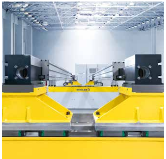
Kompakt und eine echte Alternative zur Folgeverbundfertigung: Der Schuler Intra Trans.

Der Zugang zum Werkzeug und der Werkzeugwechsel sind nach wie vor ohne Einschränkung möglich und unterscheiden sich für den Bediener nicht von den Schuler Transfers der Baureihe Pro Trans und Power Trans.