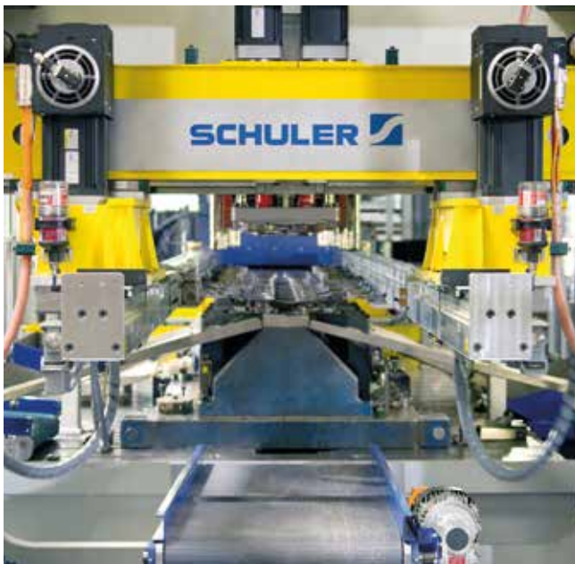
Sicherer Teiletransport und hohe Ausbringungsleistung mit den Transferlösungen von Schuler.

Ausgelegt in drei Baugrößen, deckt die neue modulare Transfergeneration ein breites Anwendungsspektrum ab und ist eine leistungsstarke Ergänzung in der Blechumformung.