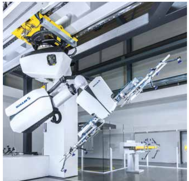
Red Dot-Product Designaward 2015 für den Crossbar Roboter 4.0.