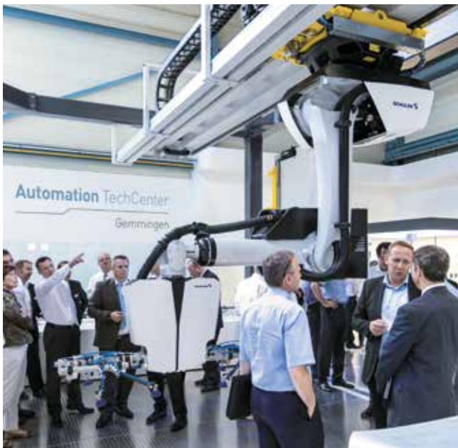
Automation TechCenter am Schuler-Standort in Gemmingen.