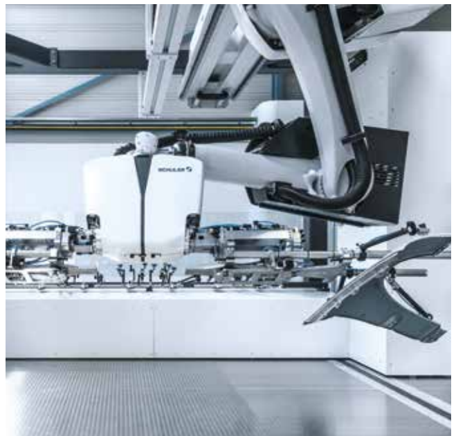
Acht-Achs-Crossbar Roboter 4.0.