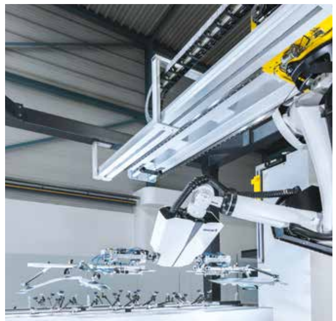
Crossbar Roboter 4.0 mit innovativer Prozessdatenschnittstelle.