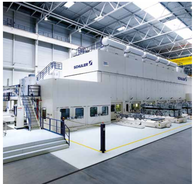
Schuler-Servoline – schnell, kompakt und flexibel.

Einsparung bis zu 60%. Mit Efficient Hydraulic Forming minimiert Schuler signifikant den Energiebedarf hydraulischer Pressen. Besonders bei Prozessen mit langen produktionsbedingten Nebenzeiten. Und das umfassend: automatisch ohne Eingreifen des Bedieners, bei allen Prozessen, in jeder Betriebsart – und bei allen Leistungsklassen!