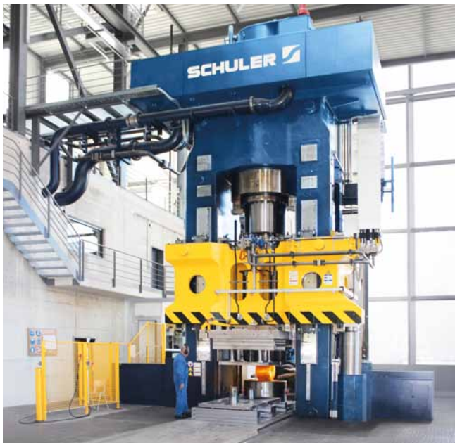
Hydraulische Schmiedepresse mit EHF (Efficient Hydraulic Forming). Energieeinsparung 60%.

Einsparung bis zu 60%. Mit Efficient Hydraulic Forming minimiert Schuler signifikant den Energiebedarf hydraulischer Pressen. Besonders bei Prozessen mit langen produktionsbedingten Nebenzeiten. Und das umfassend: automatisch ohne Eingreifen des Bedieners, bei allen Prozessen, in jeder Betriebsart – und bei allen Leistungsklassen!