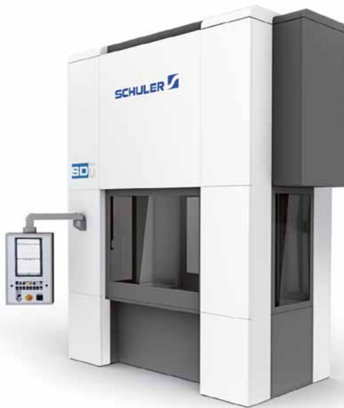
Neuer Stanzautomat MSC 2000 mit 50 % Energieeinsparung im Vergleich zu konventionellen Stanzautomaten.