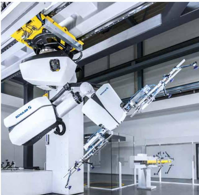
Crossbar Roboter 4.0. Energieeffizienter, leichter, dynamischer: die neue Generation der Pressenautomation.

Einsparung 20 %. Beim Einsatz des neuen Crossbar Roboters 4.0 im Vergleich zu konventionellen Industrierobotern. Intelligentes Energiemanagement mit integrierter Rückgewinnung und 50 % Gewichtsreduzierung machen diese Einsparung möglich. Auch die Handachse, der Arm des Roboters, ist wesentlich leichter. Unterm Strich summieren sich all diese Optimierungen auf einen Zugewinn an Schnelligkeit, Effizienz und Performance.