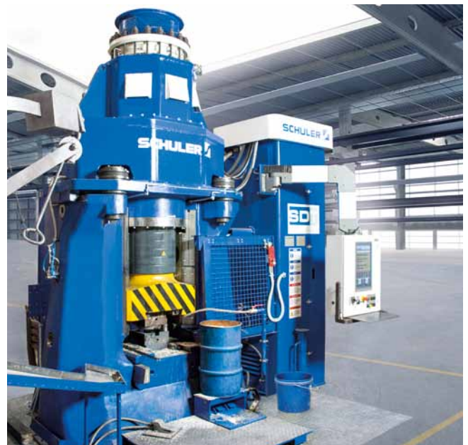
Erster Linearhammer mit Servo-Technologie.

Einsparung 20 %. Beim Einsatz des neuen Crossbar Roboters 4.0 im Vergleich zu konventionellen Industrierobotern. Intelligentes Energiemanagement mit integrierter Rückgewinnung und 50 % Gewichtsreduzierung machen diese Einsparung möglich. Auch die Handachse, der Arm des Roboters, ist wesentlich leichter. Unterm Strich summieren sich all diese Optimierungen auf einen Zugewinn an Schnelligkeit, Effizienz und Performance.